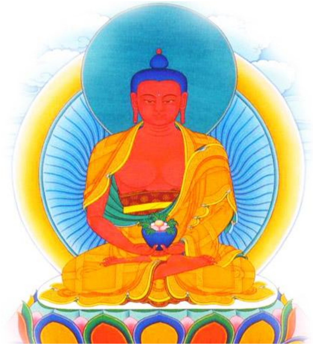
Quán tưởng Linh Ảnh đức Phật A Di Đà theo Mật tông.